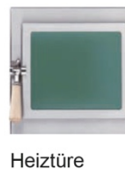
Heiztüre Modell Wien grün