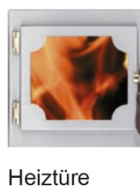
Heiztüre Romantik Salzburg mit Sichtfenster