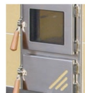
Hebelverschluss Holz hell mit Scharniere Niro