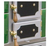
Hebelverschluss Holz dunkel Scharniere Messing