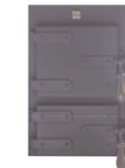
Heizbrust 2743 Schmiede einfach schwarz