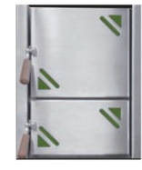
Heizbrust Trend Meran (grün) 3443