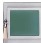
Heiztüre Modell Wien grün