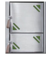
Heizbrust Trend Meran (grün) 3443