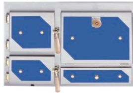
Front Romantik Tirol (blau hinterlegt)