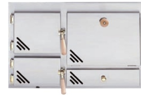
Front Modell Kärnten (schwarz)