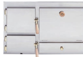
Front Modell Classico