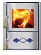
Heizbrust Trend Bajazzo (blau) 3443