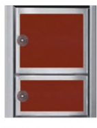
Heizbrust Trend eckig (rot) 3443