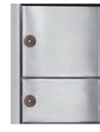
Heizbrust Trend Classico 3443