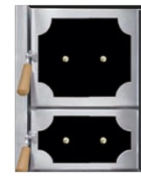
Heizbrust Trend Salzburg (schwarz) 3443