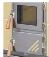
Hebelverschluss Holz hell mit Scharniere Niro