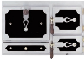
Front Romantik Salzburg (schwarz, Balkenattrappe)

E-Mail: kloss@wohnerde.at Web: www.wohnerde.at