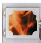
Heiztüre Romantik Salzburg mit Sichtfenster