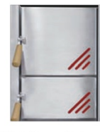
Heizbrust Trend Kärnten (rot) 3443