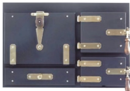
Front Schmiede einfach schwarz mit Messingbänder