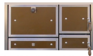
Front Trend eckige Auflage (mocca)