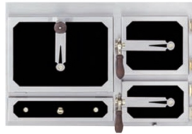
Front Romantik Linz (schwarz, Balkenattrappe)