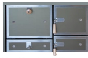
Front Trend Bad Tölz (bronze)