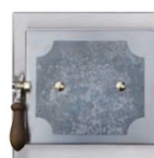
Heiztüre mit "feuergeschmiedeter" Hinterlegung li.: Romantik Salzburg; re.: Romantik Wien