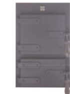
Heizbrust 2743 Schmiede einfach schwarz