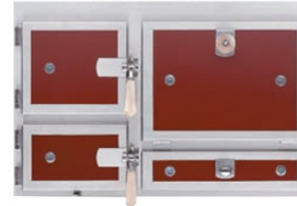
Front Modell Bad Tölz (rot hinterlegt)