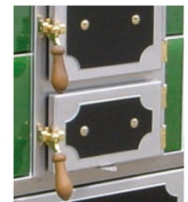
Hebelverschluss Holz dunkel Scharniere Messing